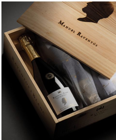
Estoig Vertical Manuel Raventós Negra