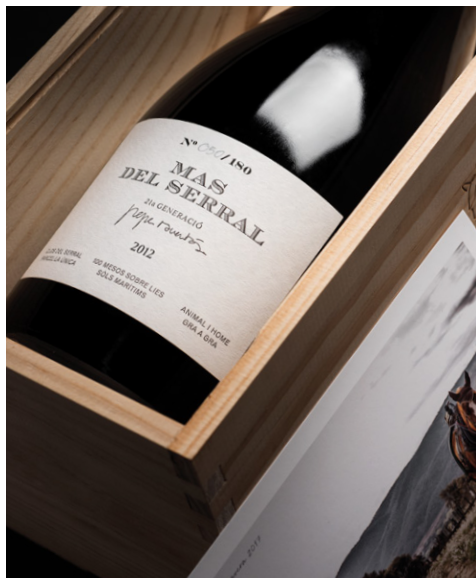
Estoig Màgnum Mas del Serral